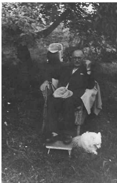
W ogrodzie (ok. 1962 roku)

To właśnie tam, wśród drzew owocowych często w wypowiedziach Doktora słyhać Jego ulubione powiedzenie: Prawda?