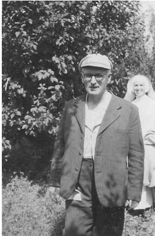
Książ (1955 rok)